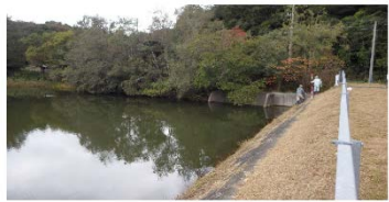
No. 1 堤体の上流側 ファイル名: 234460031131121-02.JPG