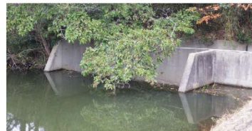
No. 4 洪水吐 ファイル名: 234460031131124-02.JPG