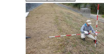
No. 3 散水施設 ファイル名: 234460031131123-01.JPG